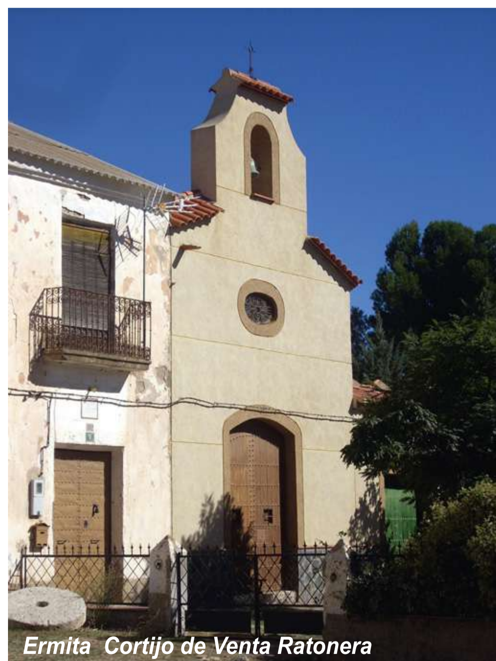
Ermita Cortijo de Venta Ratonera