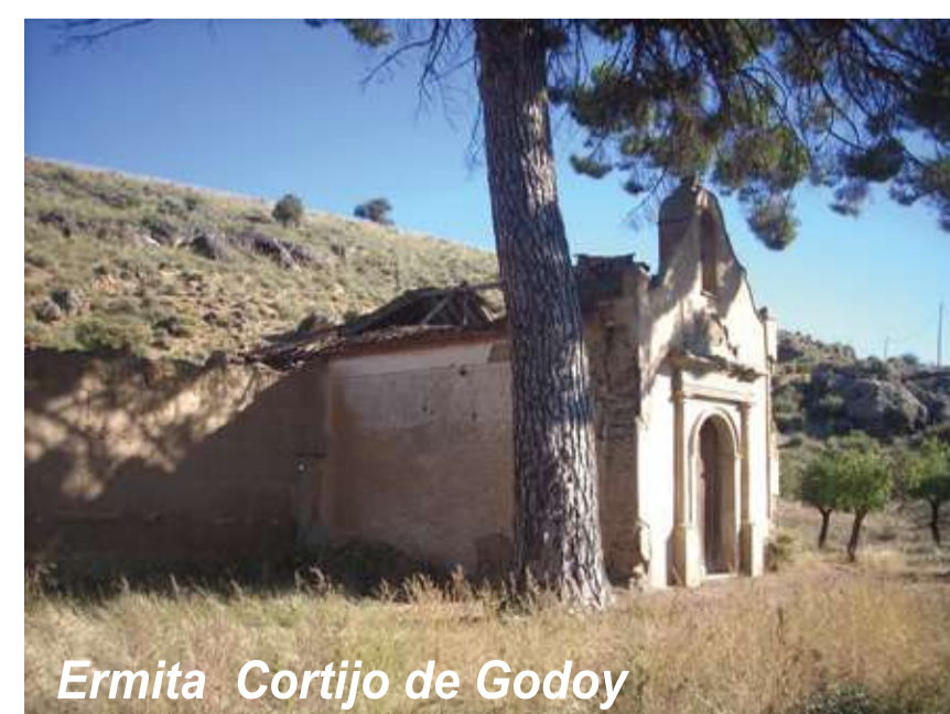
Ermita Cortijo de Godoy