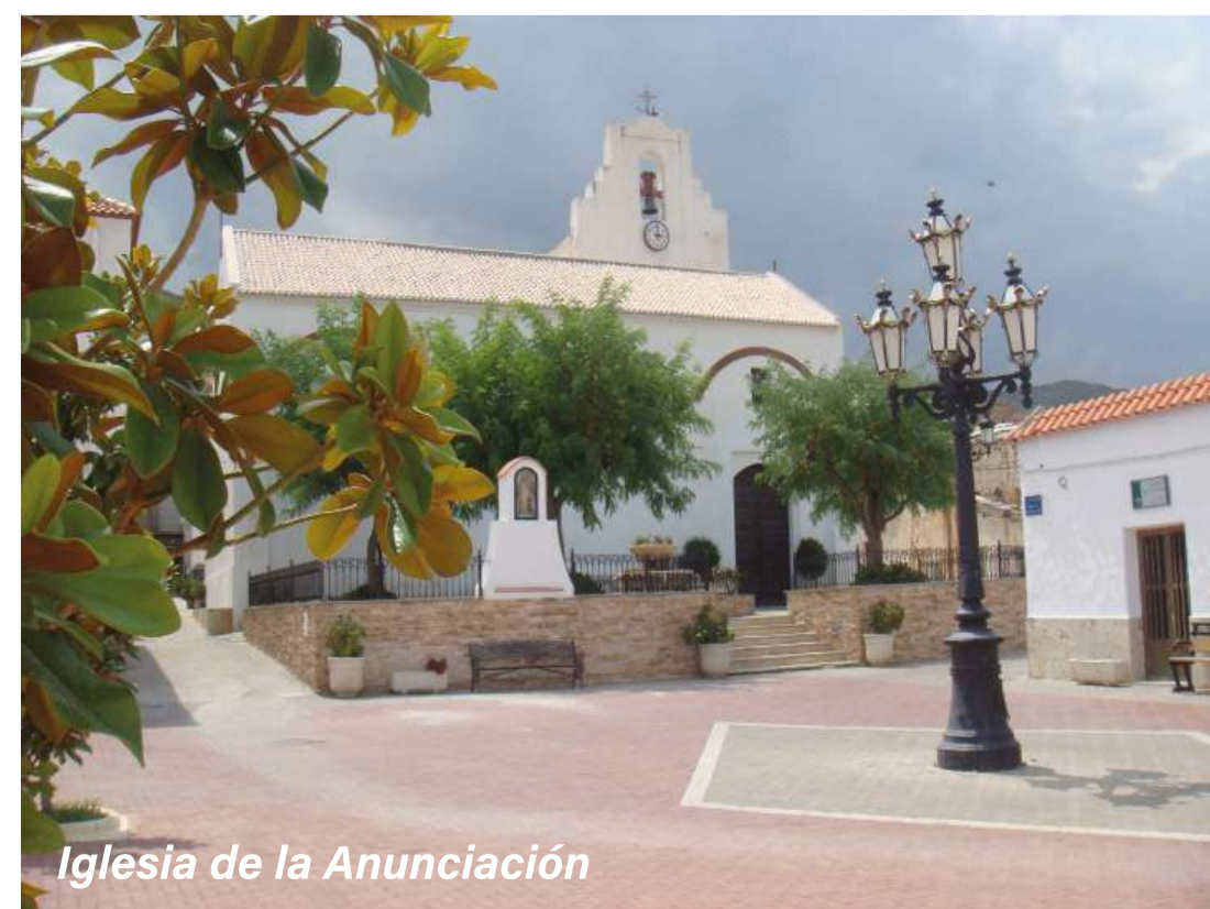
Iglesia de la Anunciación