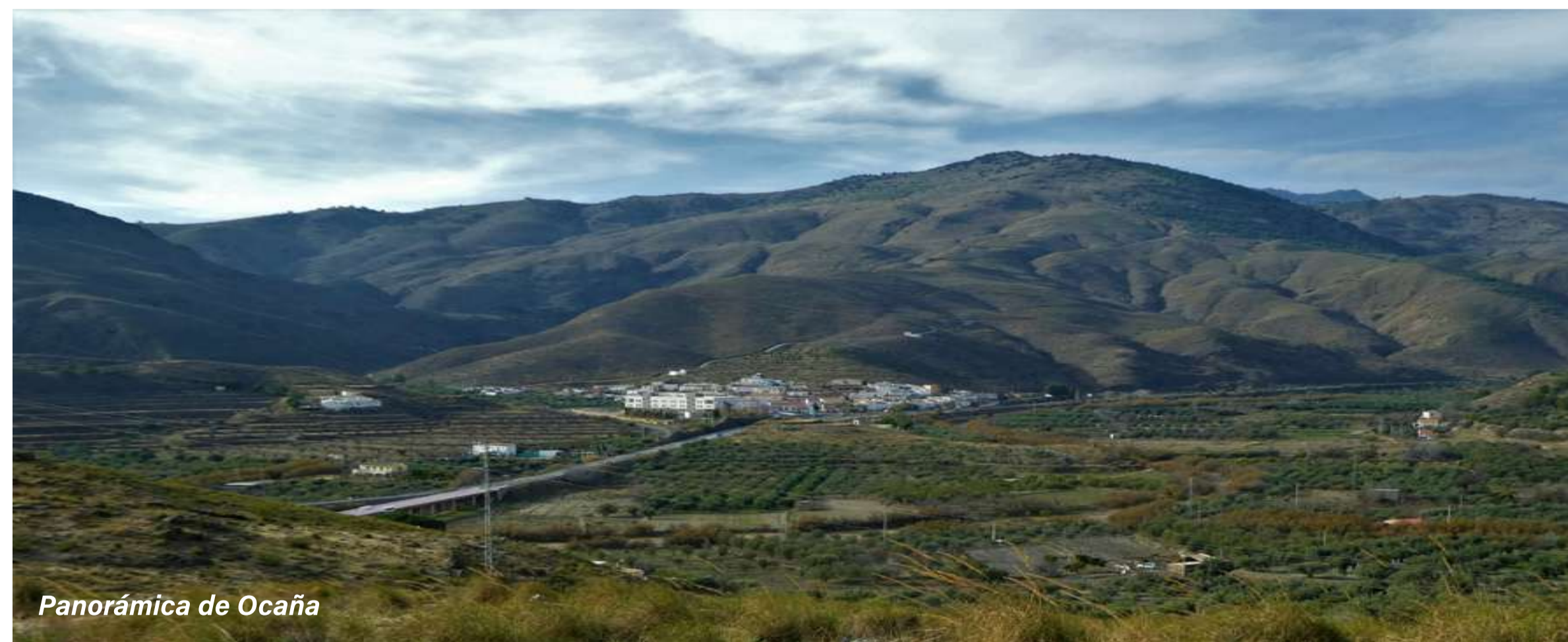
Panorámica de Ocaña