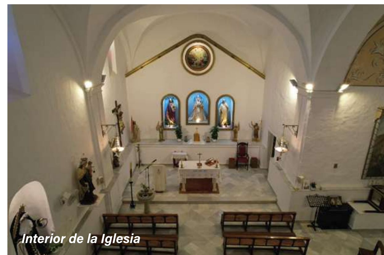
Interior de la Iglesia