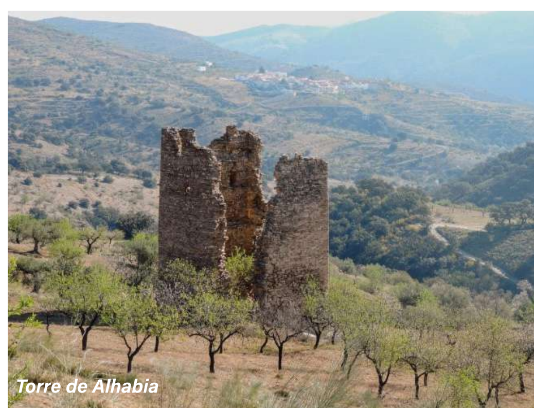
Torre de Alhabia