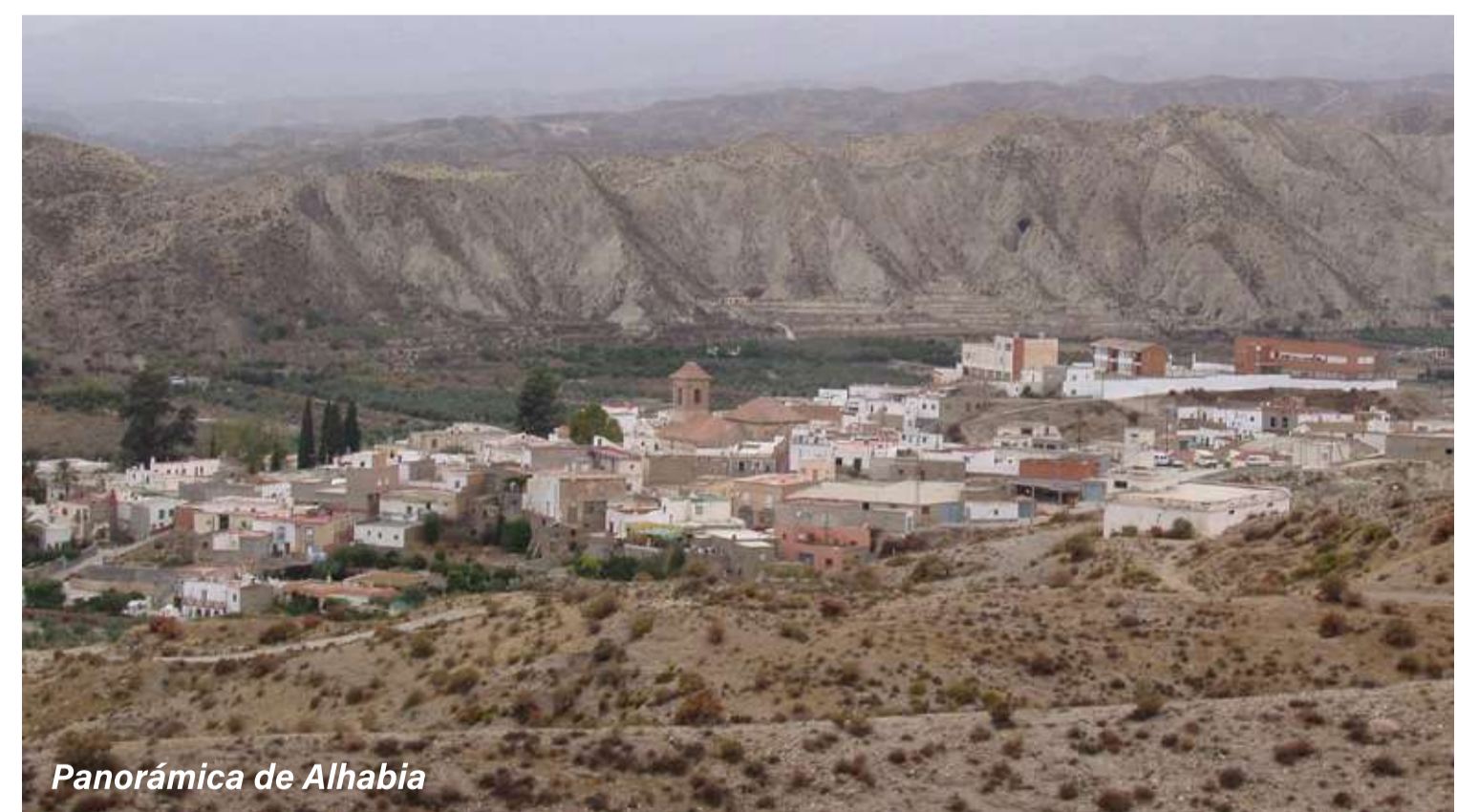
Panorámica de Alhabia