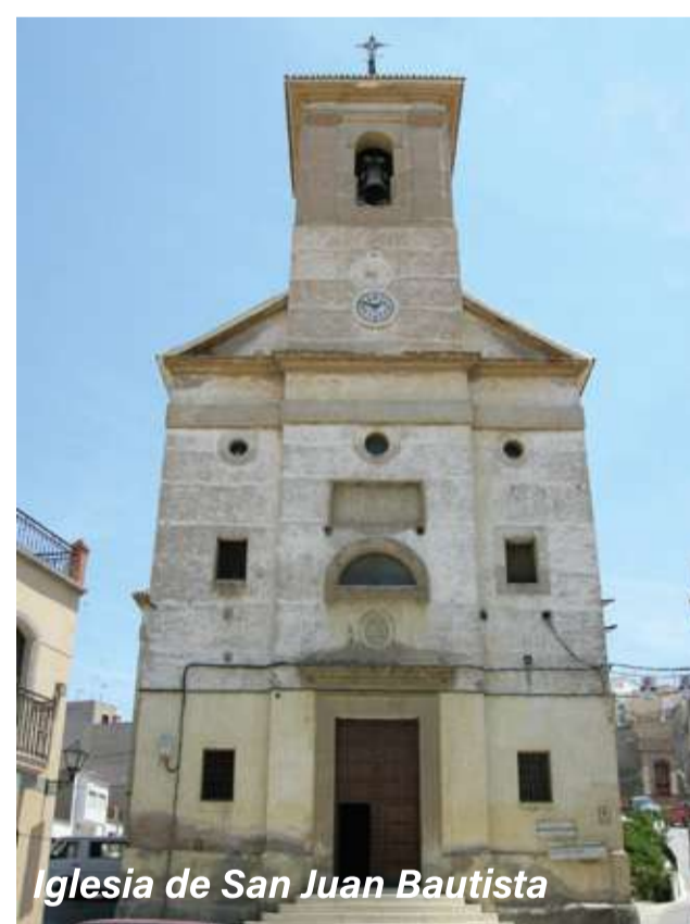
Iglesia de San Juan Bautista