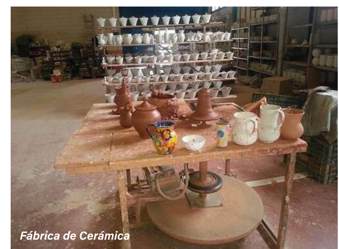
Fábrica de Cerámica