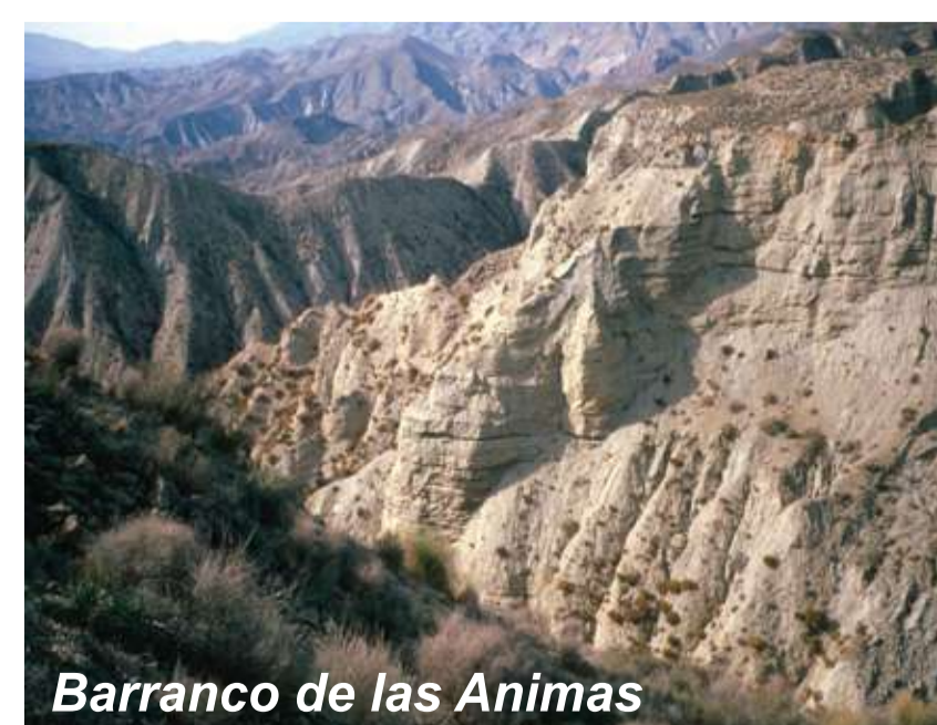
Barranco de las Animas