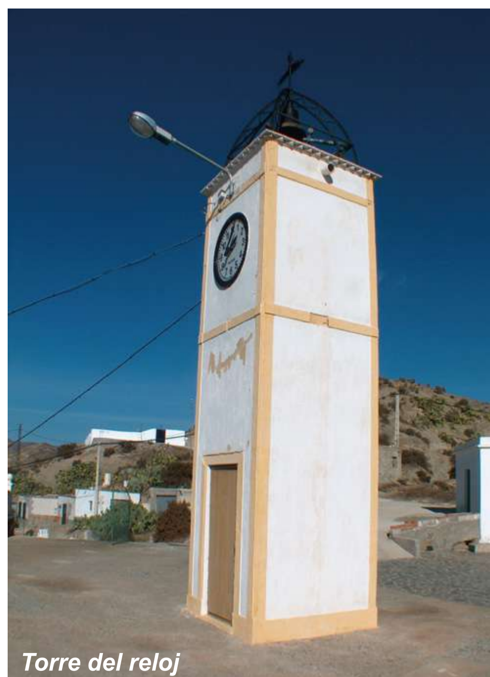
Torre del reloj