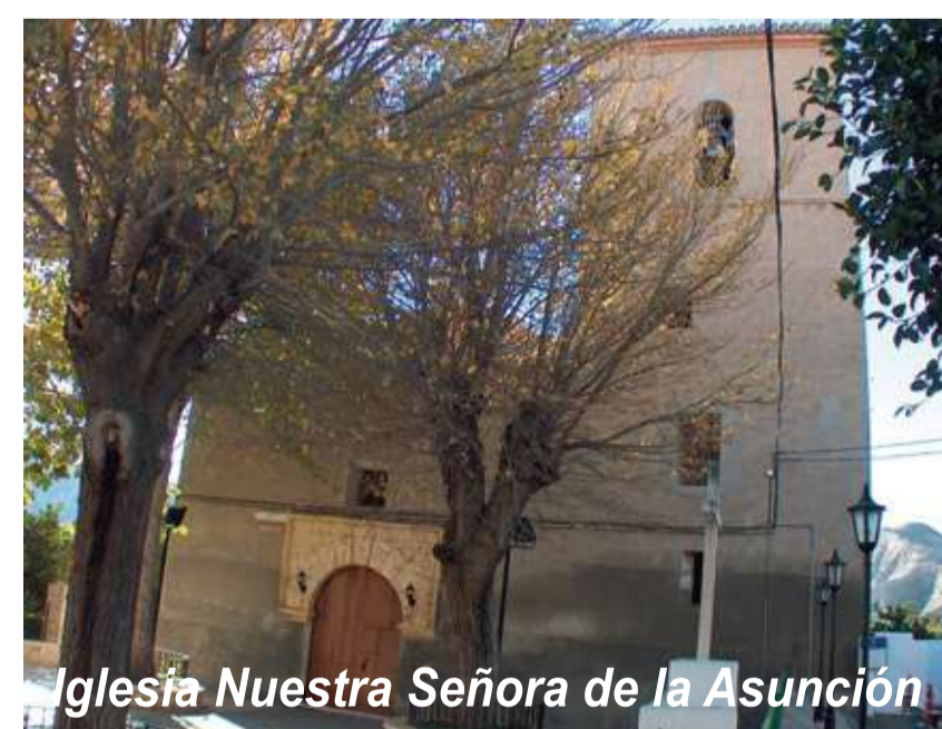
Iglesia Nuestra Señora de la Asunción