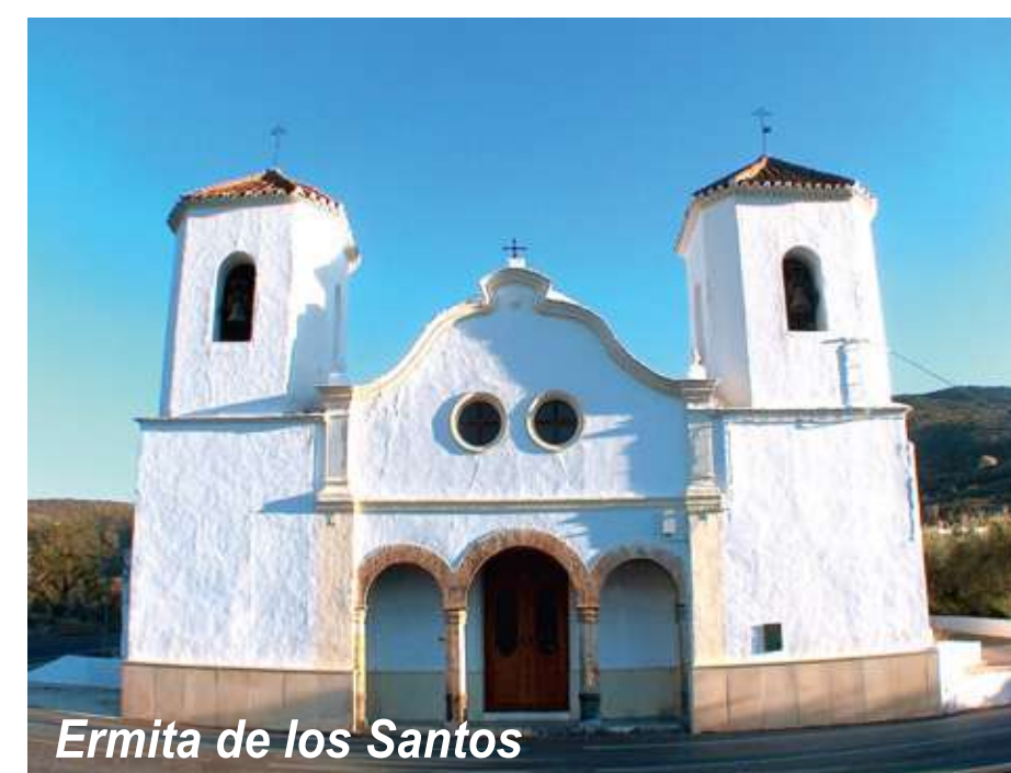
Ermita de los Santos