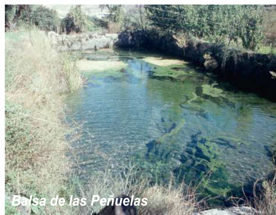
Balsa de las Peñuelas