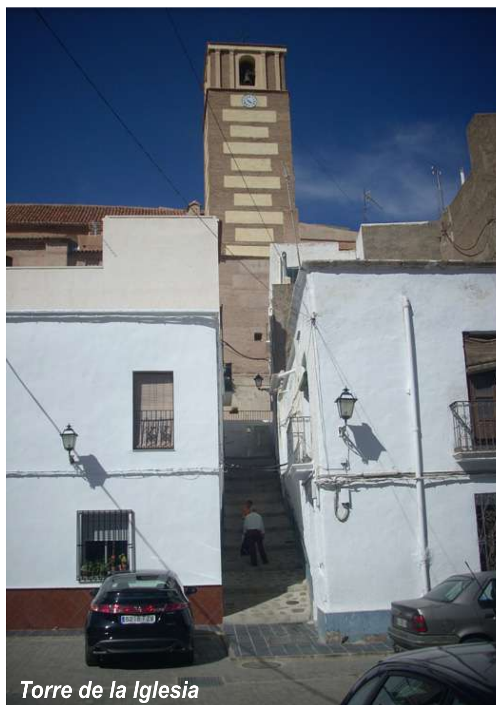
Torre de la Iglesia